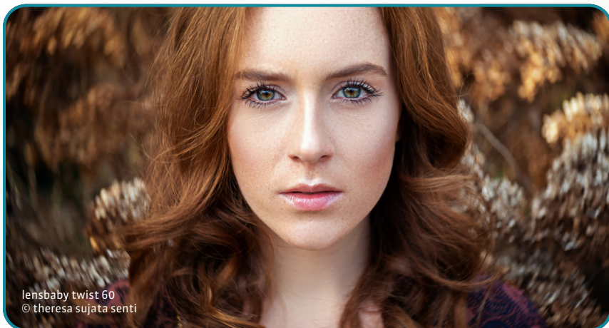
lensbaby twist 60

©2019 Lensbaby. All rights reserved. Lensbaby, the Lensbaby logo, and other Lensbaby marks are owned by Lensbaby and may be registered. All other trademarks are the property of their respective owners. v.0319 #7315