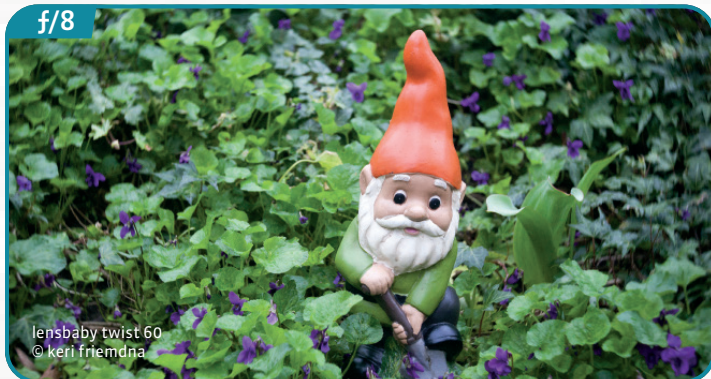
lensbaby twist 60