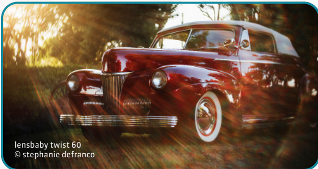
lensbaby twist 60