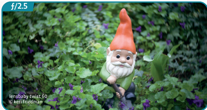
lensbaby twist 60